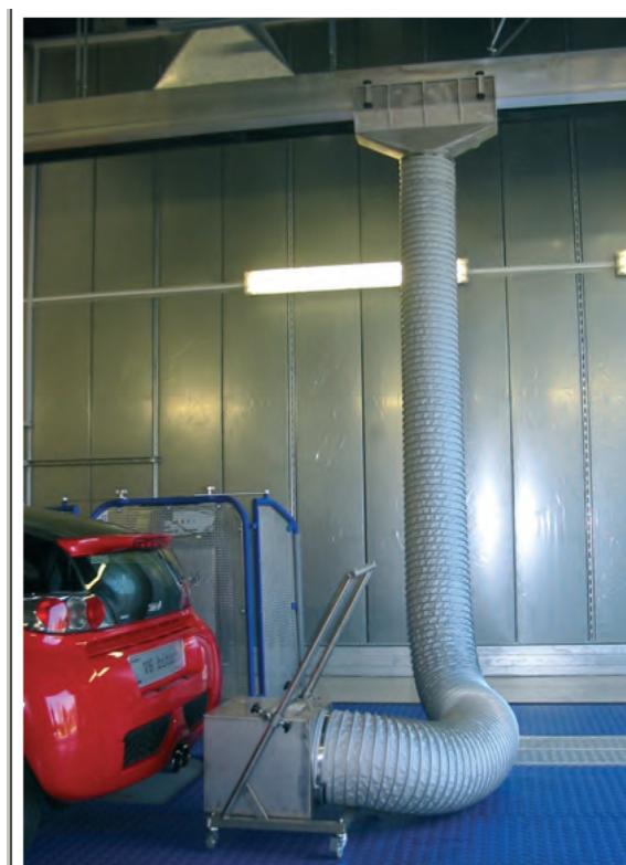
Aspiración de humos para bancos de potencia.

NOTA: También disponemos de una versión de brazo articulable para la extracción de gases de soldadura y de pintura.